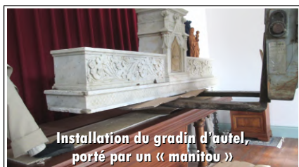
Installation du gradin d'autel, porté par un « manitou »

* 11 novembre : Une bienfaitrice nous a offert un magnifique gradin d'autel en marbre. Nous le posons sur notre autel avec l'aide d'amis, mais non sans mal, car il pèse la bagatelle de 800 kg !