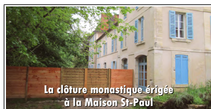
La clôture monastique érigée à la Maison St-Paul

* 1 er mars : P. Raymond prêche la récollection de carême du prieuré de Bergerac en évoquant la beauté et les exigences du Sermon sur la Montagne . Le « confinement » l'empêche malheureusement de prêcher une récollection en Corrèze.