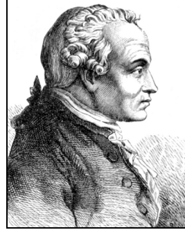
Emmanuel Kant (1724-1804)